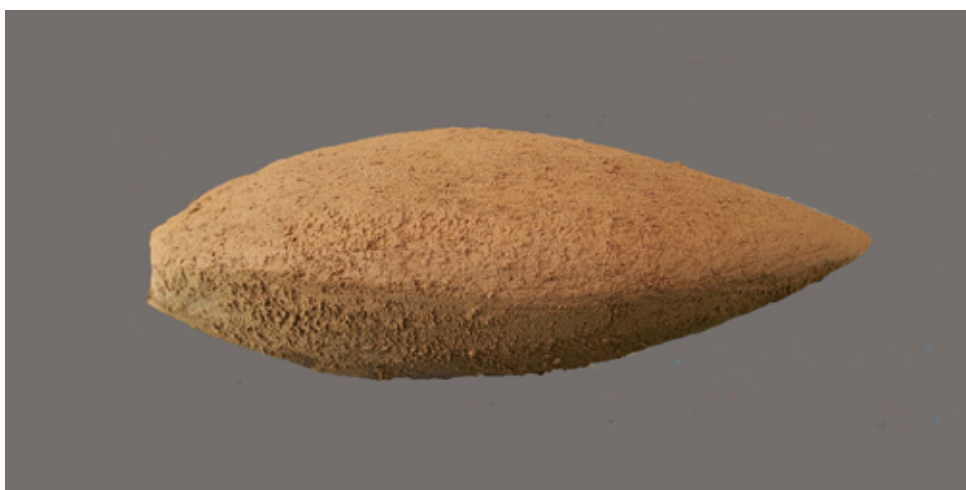
Maquette des sculptures réalisée en terre.